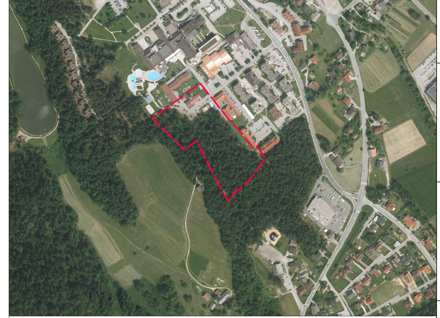
OBMOČJE OPPN NA OPN - M 1:5000