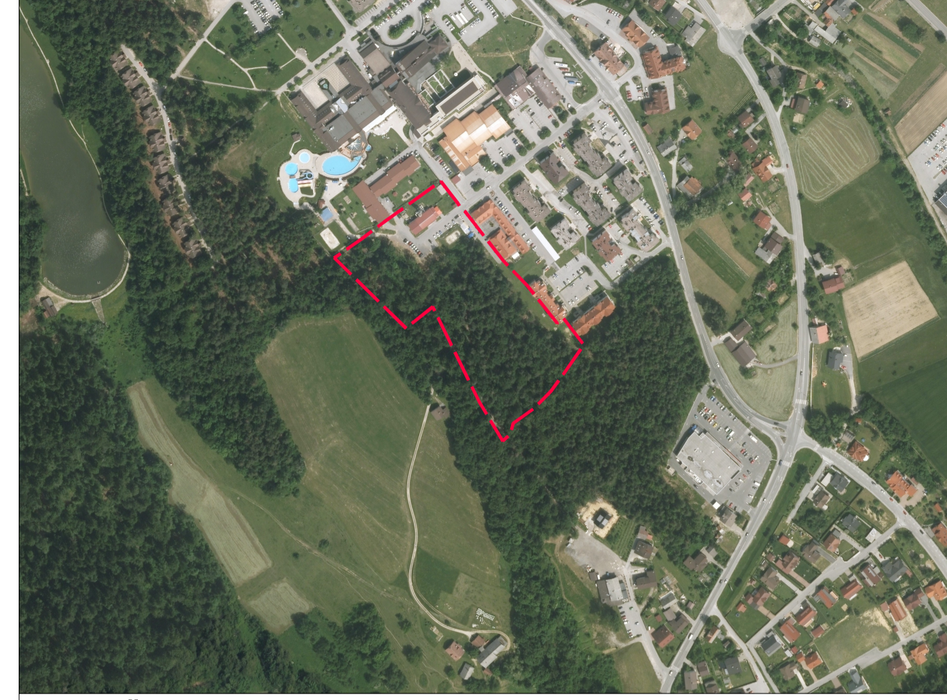
OBMOČJE OPPN NA OPN - M 1:5000