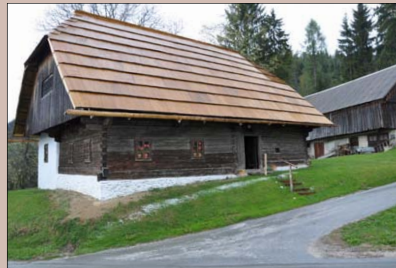
Skomarska hiša z gospodarskim poslopijem