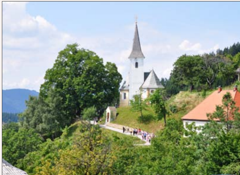
Lepa nedelja na Skomarju

pesmi, obredja, povezana s koledovanji, verovanji v nadnaravno moč vode in praznovanjem žegna, ter njihova prepletanja s pesemskim izročilom. Ukvarja se z vprašanji pričevalnosti izročila pri razjasnjevanju nekaterih dogodkov v preteklosti, predvsem v povezavi z izginulimi jezeri in potresom leta 1348. Z monografijo Na poti v Kamnik (2016) je s povezovanjem etnološkega in folklorističnega raziskovanja preučila življenje in kulturo širšega kamniškega območja, v monografiji Poslušajte štimo mojo (2021) pa je obravnavala potujoče pevce in pesemske letake na Slovenskem. Svoje raziskave predstavlja na znanstvenih srečanjih doma in v tujini, raziskovalne izkušnje pa od leta 2020 posreduje tudi študentom na Oddelku za etnologijo in kulturno antropologijo Filozofske fakultete Univerze v Ljubljani.