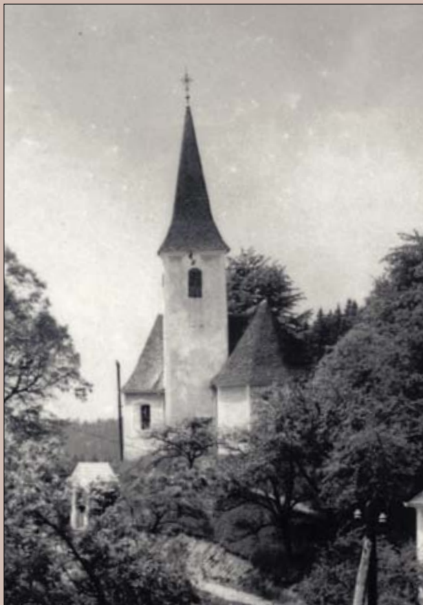
Cerkev sv. Lamberta na Skomarju nekoč; uradni zapis priča, da je na Skomarju že leta 1157 stala lesena kapela.