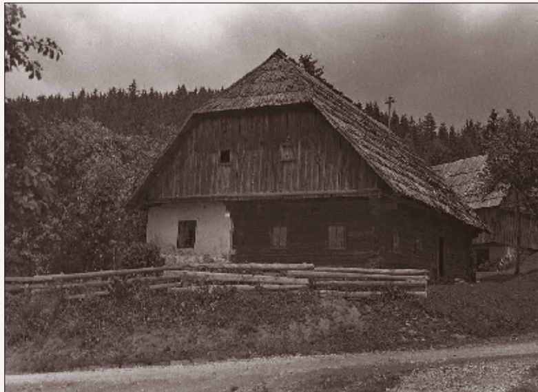
Skomarska hiša nekoč