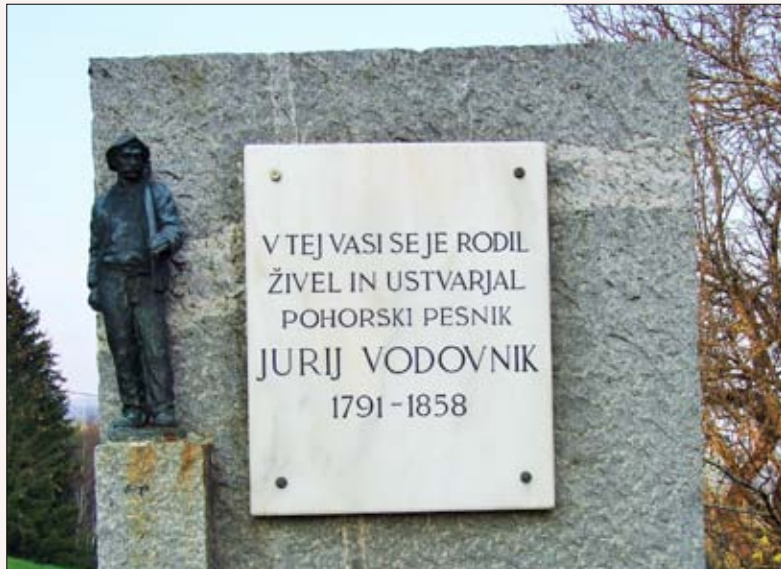
Spominsko obeležje pri skomarski šoli

V ljudski medicini na Slovenskem so smrekovo smolo uporabljali za zdravljenje dihal (pri prehladu, gripi, proti kašlju), za celjenje ran, proti srbečici, pri pikih insektov, za zdravljenje glivičnih obolenj in za vtiranje pri sklepnih obolenjih (revma, artritis). Udeleženci se bodo naučili pripraviti mazilo iz smrekove smole za domače samozdravljenje.