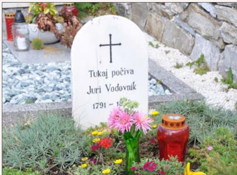
Skromen pesnikov grob na skomarskem pokopališču

Je prejemnik prestižne Štrekljeve nagrade za življenjsko delo v letu 2015 ter slovenski ambasador kulturno-umetnostne vzgoje.