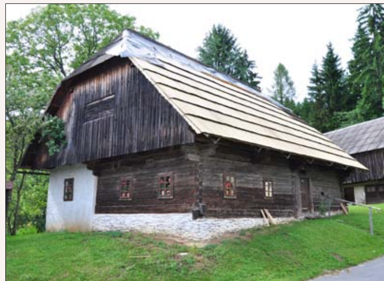
Skomarska hiša, center kulturnega dogajanja

Vodovnik je torej kljub veliki časovni distanci še vedno prisoten. Ob tem se postavlja vprašanje, kaj ga dela še danes tako zanimivega. Odgovor ni preprost, in ravno zaradi tega bomo v letošnjem letu, ko se spominjamo njegove 230-letnice rojstva, s priloženim programom predavanj odkrivali malo manj znano področje njegovega življenja. Gotovo bomo spoznali kaj novega, kaj takšnega, da nam bo še bolj blizu, še bolj naš.