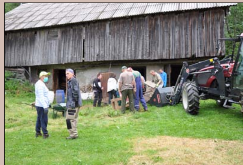
Urejanje gospodarskega poslopija ob Skomarski hiši