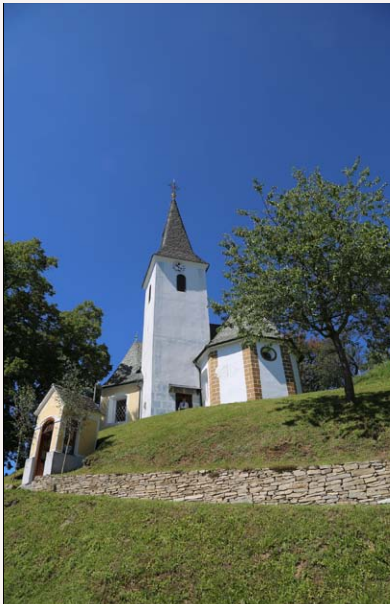
Cerkev sv. Lamberta na Skomarju danes