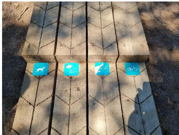
Slika št. 2 in 3 : Obnova in nadgradnja brunčanih poti s piktogrami