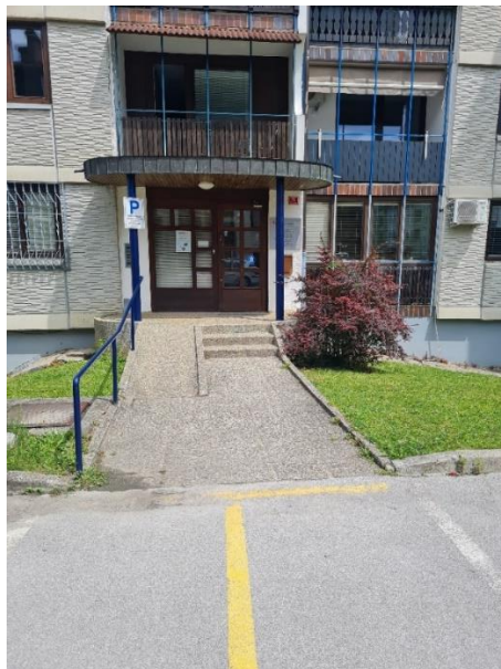
Slika 5: Obstoječa situacija vhoda v knjižnico Zreče

Naročili smo izdelavo idejne zasnove (v nadaljnjem besedilu: IDZ) preureditve dostopa do knjižnice Zreče (Cesta na Roglo 11h). Rešitve prilagojenega dostopa je izdelal Projekt Gregor Furman s.p. IDZ obravnava funkcionalno preureditev platoja pred vhodom in vhoda v knjižnico Zreče primerne za dostop gibalno oviranim osebam.