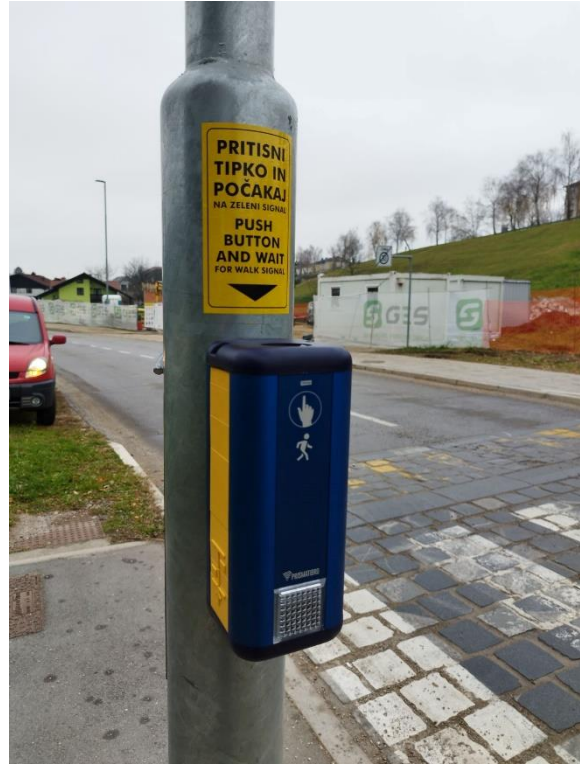
Slika 3 in 4: Ureditev zvočne signalizacije na semaforju pri prehodu pri OŠ Zreče