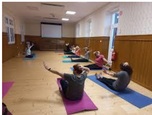
Slika 9: Telovadba v čakalnici Železniške postaje

V mesecu novembru 2024 smo v okviru Večgeneracijskega centra izvajali skupaj s srčno prostovoljko Darinko jogo za dobro jutro v VDC Čebelice Slov. Konjice.