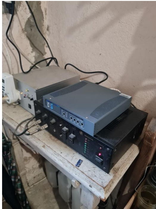
Slika 1 in 2: Ureditev induktivne zanke v cerkvi sv. Kunigunde na Gorenju