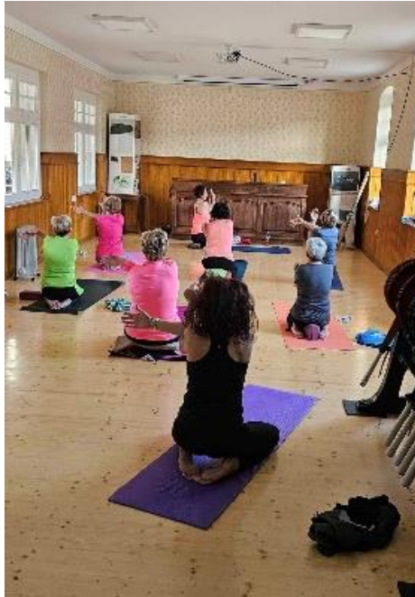
Slika 8: Joga v čakalnici Železniške postaje