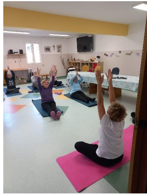
Slika 10: Telovadba za dobro jutro v organizaciji VDC Zreče