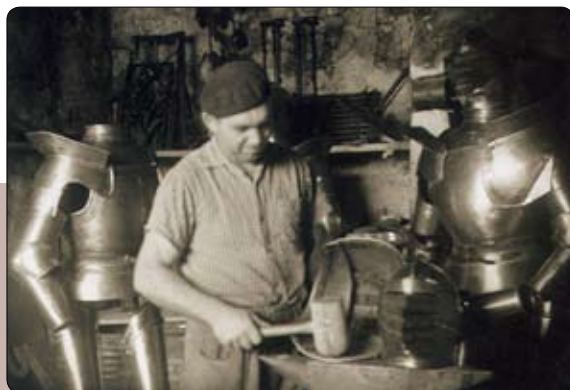
Stara kovaško tradicijo neguje obnovljena kovačija