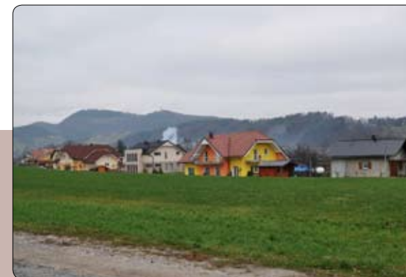
Novo stanovanjsko naselje z Brinjevo goro v ozadju

Področje KS Dobrovlje je preprejeno s potmi in nadvse primerno za rekreacijsko kolesarjenje ter sprehode. Na južni strani ravnice je tudi vadbišče za golf.