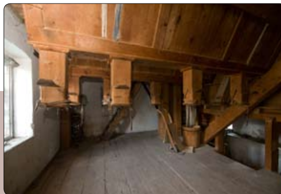
Lepo ohranjena originalna notranjost mlina

V bližini vasi Gabrovlje je bil vse do leta 1914 ribnik - Teich so ga imenovali, ko so ga zasipali z jalovino iz rudnika in potok Ulčince si je do reke Dravinje izbral novo pot kjer je nastalo močvirje. Danes je to področje izsušeno in zemlja je zelo rodovitna, zato je kmetijstvo ena izmed pomembnih gospodarskih panog. Po letu 1960 so nekaj let tukaj gojili tudi hmelj.