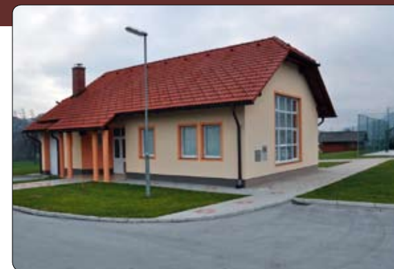
Večnamenski Dom krajanov s športnim igriščem

Danes premore Krajevna skupnost Dobrovlje Dom krajanov, urejeno asfaltirano igrišče, vrtino za termalno vodo Term Zreče, med cestama za Domom krajanov pa nastaja novo naselje stanovanjskih hiš in že beležimo porast prebivalcev, ki jih je skupaj 400. Potekajo aktivnosti za ustanovitev Kulturno turističnega društva in dogovori o tradicionalni prireditvi. Kovačija Šrekl - Zajc in valjni mlin Kohne oziroma Bocijev mlin pričakujeta tudi tiste, ki jih zanima naša tehniška kulturna dediščina.