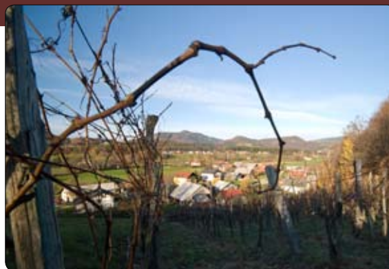
Pogled na Dobrovlje z južne strani