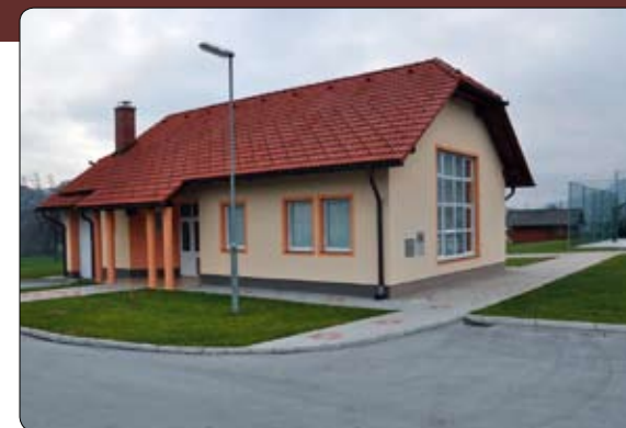
Véchnamenski Dom krajanov s športnim igriščem

Danes premore Krajevna skupnost Dobrovlje Dom krajanov, urejeno asfaltirano igrišče, vrtino za termalno vodo Term Zreče, med cestama za Domom krajanov pa nastaja novo naselje stanovanjskih hiš in že beležimo porast prebivalcev, ki jih je skupaj 400. Potekajo aktivnosti za ustanovitev Kulturno turističnega društva in dogovori o tradicionalni prireditvi. Kovačija Šrekl - Zajc in valjni mlin Kohne oziroma Bocijev mlin pričakujeta tudi tiste, ki jih zanima naša tehniška kulturna dediščina.